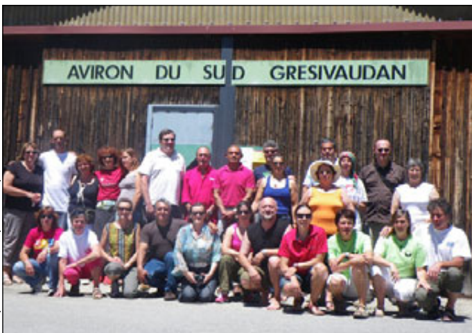
La photo des participants

Puis ce fut le temps du réconfort avec bien sûr les spécialités locales. Et tout s'est terminé dans la bonne humeur et en chansons sur le bord de l'Isère... Rendez-vous au mois d'août au Portugal pour quatre rameurs du Sud Grésivaudan.