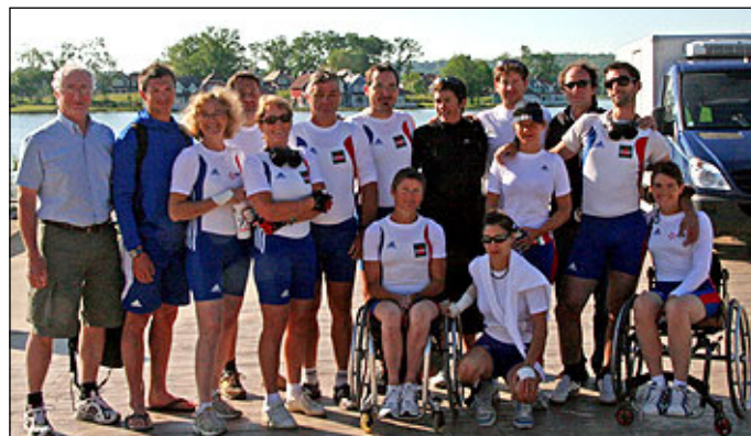
Les équipes Handi-aviron

En ce début d'olympiade qui va mener à Londres 2012, la Fédération a souhaité préparer et qualifier les quatre embarcations présentes au programme des Jeux Paralympiques : skiff homme bras seul, skiff femme bras seul, double mixte bras et corps, quatre avec barreur mixte bras, corps, jambes.