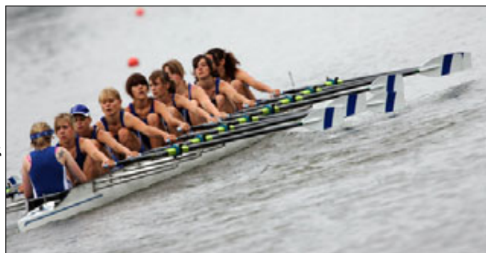
CN Chambéry, médaille d'Or