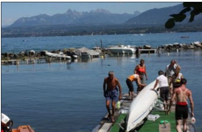
La yolette lors de sa cure de jouvence.