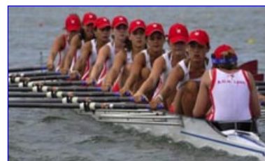
3ème avec 52 pts