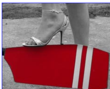
1er avec 65 pts