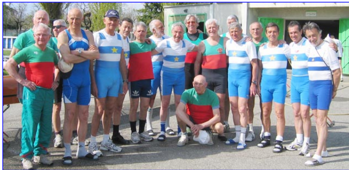
Les vétérans «G» Turinois et Aixois

Match Aix-Turin créé en 1921, vainqueurs en 2010 les Turinois, 3 victoires à 2 devant les Savoyards. AQ