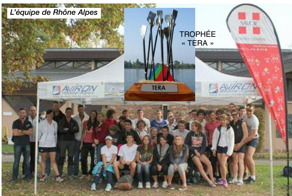
L'équipe de Rhône Alpes