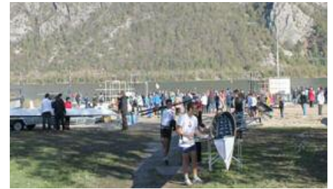
Le parc à bateaux