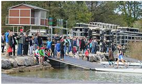
Spectateurs au parc à bateaux