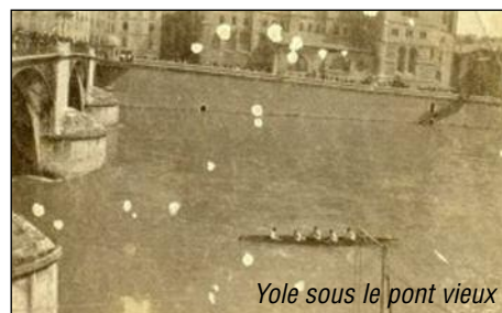
Yole sous le pont vieux

A cette époque les rameurs utilisent des yoles et des "outriggers".