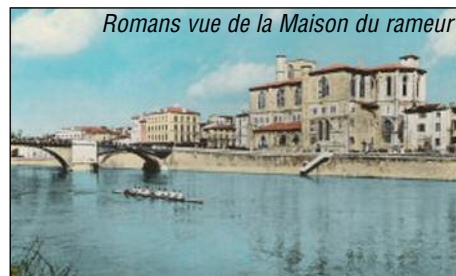
Romans vue de la Maison du rameur

En 1976, l'Aviron Romanais Péageois consent une donation de la base FENESTRIER à la Ville de Romans, aménage un gymnase un centre d'hébergement pour faire un véritable complexe sportif.