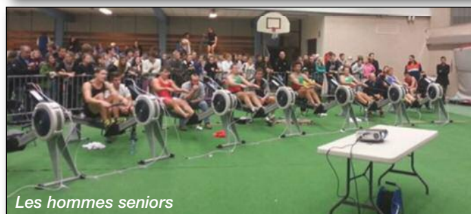
Les hommes seniors