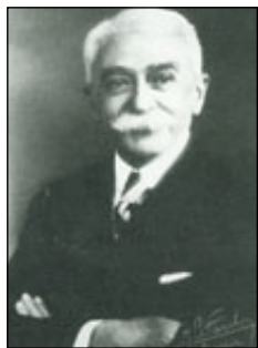
Le Baron Pierre de Coubertin.

À Paris, le 23 juin 1894, clôture du premier congrès olympique, le baron Pierre de Coubertin fonde le Comité international olympique afin de faire revivre les anciens Jeux olympiques après une absence de plus de 1500 ans. Il voulait ainsi contribuer à bâtir un monde pacifique au moyen du sport en promouvant la communication, le fair-play et l'entente entre les peuples. Le CIO est une organisation dont le but est de localiser l'administration et l'autorité pour les jeux, ainsi que de fournir une seule entité légale qui détient tous les droits et les marques. Par exemple le logo olympique, le drapeau, la devise et l'hymne olympique sont tous administrés et possédés par le CIO. Le président du Comité olympique représente le CIO dans son ensemble, et les membres du CIO représentent le CIO dans leurs pays respectifs.