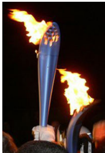
La Flamme Olympique des Jeux d'Hiver à Turin

La flamme olympique est un symbole qui nous vient des Jeux Olympiques de l'antiquité au cours desquels