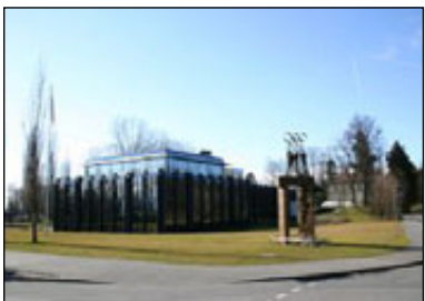
Le siège du CIO à Lausanne

Le CIO est composé de 115 membres qui se réunissent au moins une fois par an, et élisent un président pour une durée de 8 ans. Les membres sont tous des personnes physiques. Le CIO comprend notamment parmi ses membres, des athlètes actifs, d'anciens athlètes, ainsi que des présidents ou dirigeants au plus haut niveau de fédérations internationales de sports, d'organisations internationales reconnues par le CIO. Le CIO recrute et élit ses membres parmi les personnalités qu'il juge qualifiées. Les moyens financiers proviennent d'une part des droits de retransmission télévisée et d'autre part des partenariats avec des sociétés multinationales.