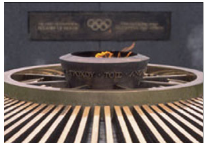
Flamme Olympique au CIO à Lausanne

Le musée présente des expositions temporaires et des expositions permanentes. FIN