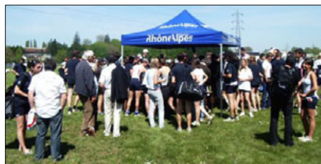
Chapiteau Rhône Alpes et les rameurs à la coupe de France