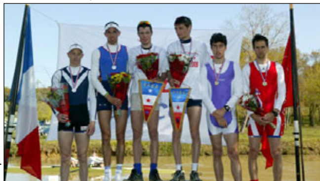
Le podium du 2-HSPL