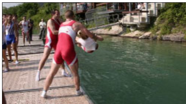
Tradition respecter barreur à l'eau...

Le samedi 381, le dimanche 452 bateaux étaient présent à la 23ème régates Internationale de Savoie, 50 finales sur un bassin à 10 lignes d'eau, avec la présence de 12 clubs Suisse, 1 club Allemand et 55 clubs Français.