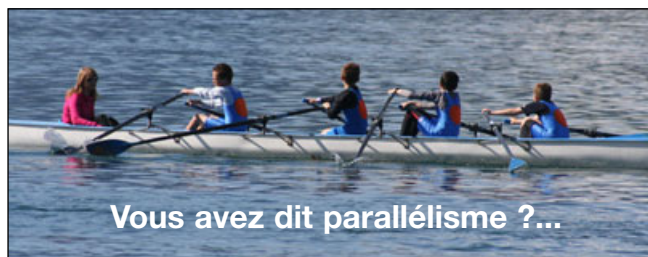
Le quatre du CN Talloires

Le club hôte s'est taillé la part du lion en remportant les trois challenges mis en jeu grâce, notamment, à un effectif complet. Ceci laisse augurer un avenir prometteur et une belle bataille pour les prochaines échéances avec des clubs avides de saines revanches. Claude Jacquier.