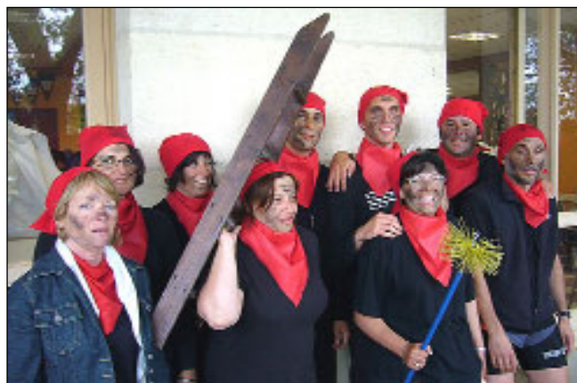
Les rame-honneurs en tête de leur série

Le samedi 17 mai, face au pont Bénézet d'Avignon et dans les structures du club local, la MAÏF, associée à la FFSA, accueillait le personnel des délégations du sud-est pour le challenge aviron.