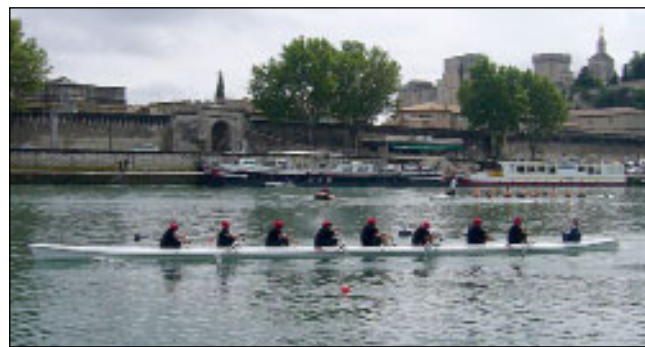
Le huit des rame-honneurs à l'arrivée

Rhône-Alpes a brillamment figuré avec Bourg en Bresse 1er, Grenoble 3e et pour la première fois Annecy qui, pour une petite délégation, réussit à constituer un équipage et termine à la cinquième place, ce qui lui ouvre la porte de la finale de Mimizan en octobre. Claude Jacquier