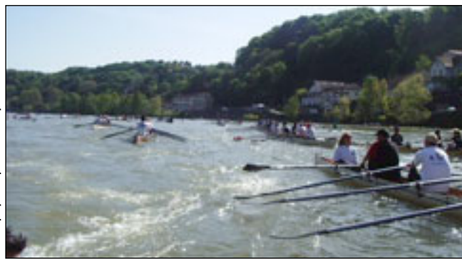
Les équipes quittent le ponton de l'AUNL

Il est maintenant de tradition pour le premier mai de voir toute une flotille de randonneurs se lancer à l'assaut de la Saône pour traverser Lyon, sous l'égide de l'équipe organisatrice de l'AUN Lyon.