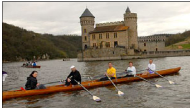
La pose photo devant le château.

Le week end du 20 avril, près de 200 rameurs loisirs se sont retrouvés au lac de Villerest afin de participer à l'un des deux circuits de la Randonnée du Lac. Merci à l'ensemble des participants, ainsi qu'à l'équipe d'organisation qui ont permis le bon déroulement de cette manifestation.