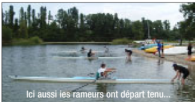
3 un de couple au ordre du styrer.

Maintenant tout ce petit monde n'a plus qu'à s'exprimer lors des épreuves de zone qualificatives pour le Championnat national.