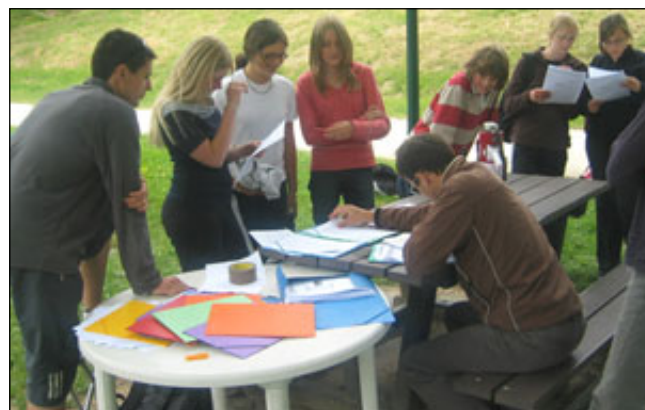
La table des examinateurs

Le comité départemental de Haute-Savoie avait en charge d'organiser la première épreuve décentralisée de l'aviron d'or version 2008, ce mercredi 21 mai. Dans un souci de promouvoir de nouveaux sites et changer les habitudes, le petit plan d'eau de La Balme de Sillingy nous est apparu bien convenir pour cette opération.