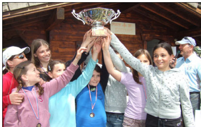
Le sourire des vainqueurs.