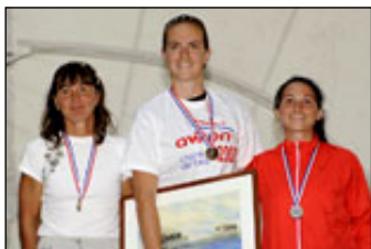
Le podium Femme Seniors, 1 de couple