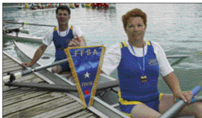
2xLTA, Handi, 1er ACL Aiguebelette