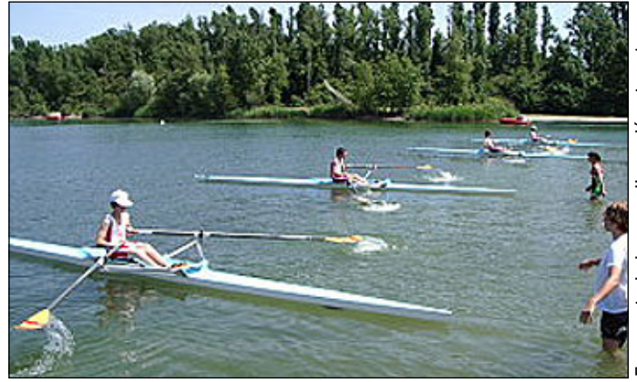
Epreuve technique sur l'eau, départ en 1x

C'est une nouvelle fois, le site du parc de Miribel Jonage qui accueillait l'aviron pour cette organisation.