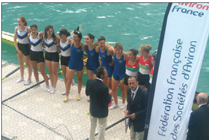
4- Femme, le podium, 1ère ACL Aiguebelette, 3ème A. Grenoble

Article : A. Quoëx - Photos : FFSA, AQ, A. Grenoble