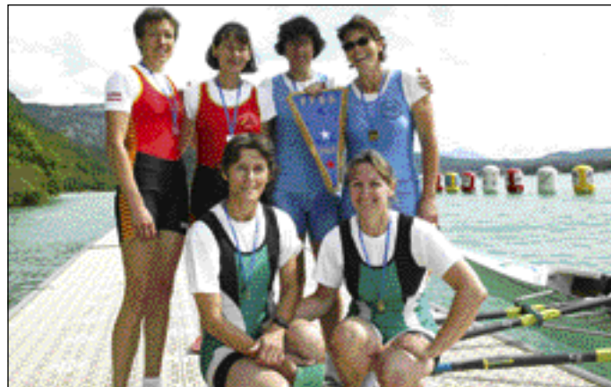
2xSF vétérans, le podium, 1ère CN Talloires