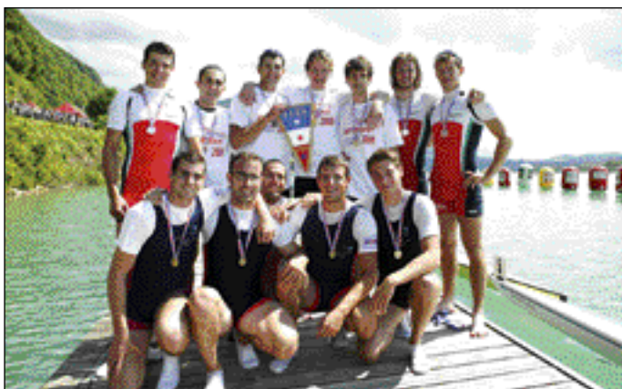
4xHomme, le podium, 2ème AUN Villefranche