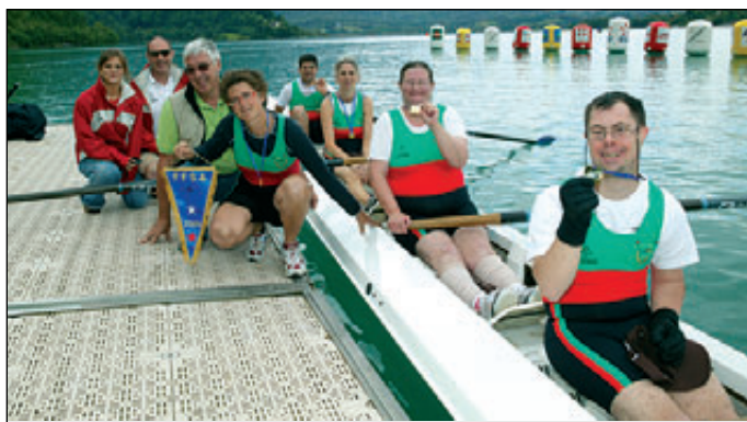
4-LTA Handi; 1er EN d'Aix les Bains