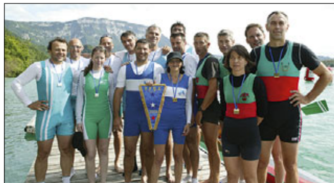
4-SH vétérans, le podium, CSAV, ENAB