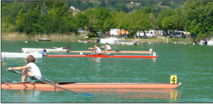
Au départ, prêt, partez !