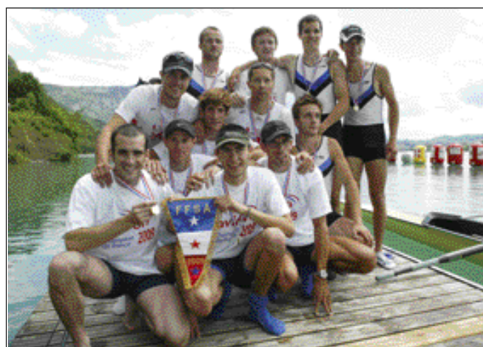
8+ Homme, CN Annecy, 2ème 4x Femme, le podium, 1ère Acy le Vieux 4+ Homme le podium, 2ème AJUN Lyon, 3ème A. Grenoble