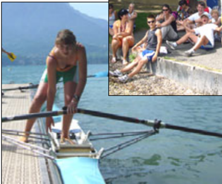
Un pied, au large...