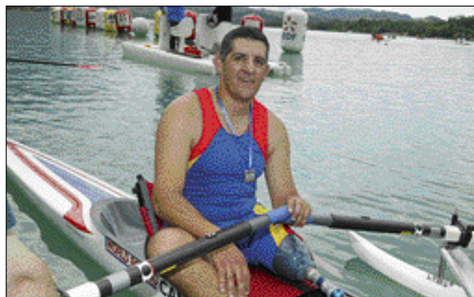
1xLTA Handi; 2ème CA Thonon