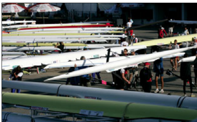
Le parc à bateaux de Poznan

Mise en page d'André Quoëx, d'après les informations de la Fédération