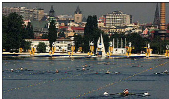
Le bassin Lac Malta de Poznan