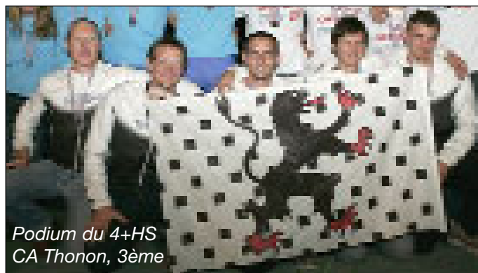
Podium du 4+HS CA Thonon, 3 ème

HS4+ : 3 ème CA Thonon, médaille de Bronze, 32 ème Aviron Grenoblois, non classé Aviron Majolan et la 2 ème équipe du CA Thonon