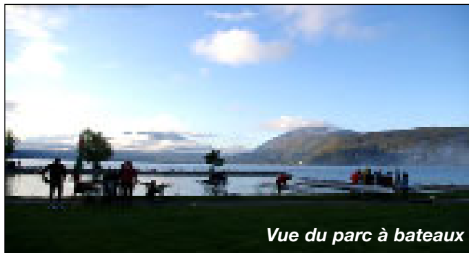
Vue du parc à bateaux

Dimanche 11 octobre 2009 Tour du Lac d'Annecy – 28 kms