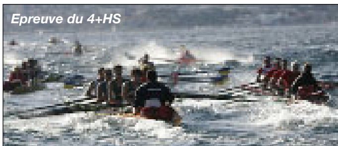
Epreuve du 4+HS

HJ4+ : 5 ème CA Thonon, 7 ème Aviron Majolan