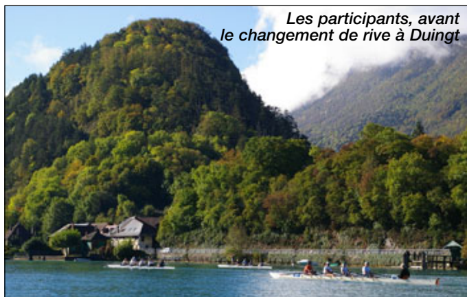
Les participants, avant le changement de rive à Duingt

article Isabelle Fagault/André Quoëx