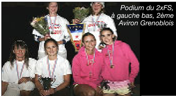
Podium du 2xFS, à gauche bas, 2 ème Aviron Grenoblois

FS2x : 2 ème Aviron Grenoblois, médaille d'Argent, 4 ème Aviron Majolan