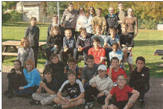
Les minimes stagiaires