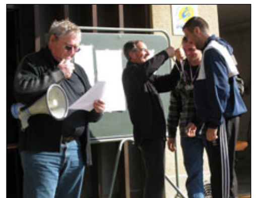
Texte et photos CD 26-07

permis aux nombreux rameurs de se confronter. A noter que l'ensemble des courses du programme a été disputées alors que les années précédentes les minimes filles et seniors femmes faisaient défaut.