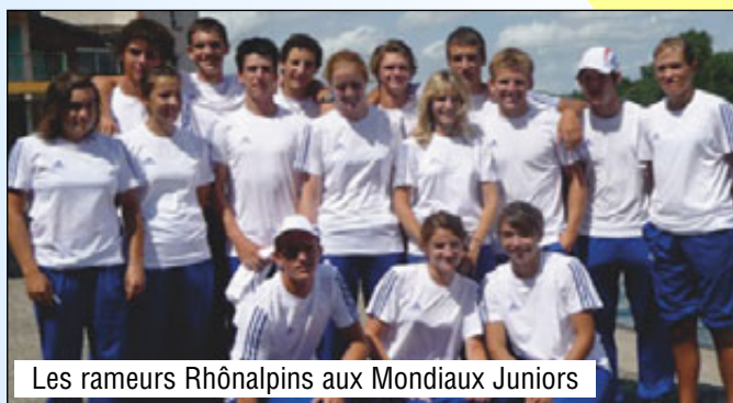
Les rameurs Rhônealpins aux Mondiaux Juniors

La France et 11 nations étaient représentées, à cette Coupe de la Jeunesse 2009. Dans le contingent des rameurs de la FFSA, 3 rameurs et 2 rameuses de la Région Rhône Alpes étaient présents.