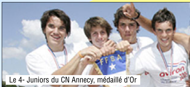
Le 4- Juniors du CN Anancy, médaillé d'Or

Belle moisson de médailles pour les cadets des clubs Rhônealpins, 4 Or, 7 argent, 4 Bronze.