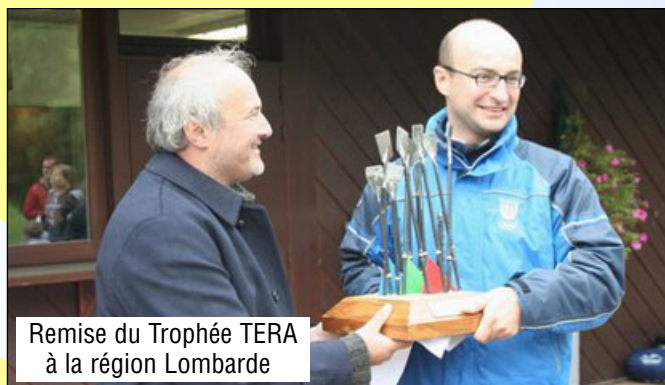
Remise du Trophée TERA à la région Lombardie

Médaille d'Argent en F2x Aviron Grenoblois - Médaille de Bronze Aviron Thonon