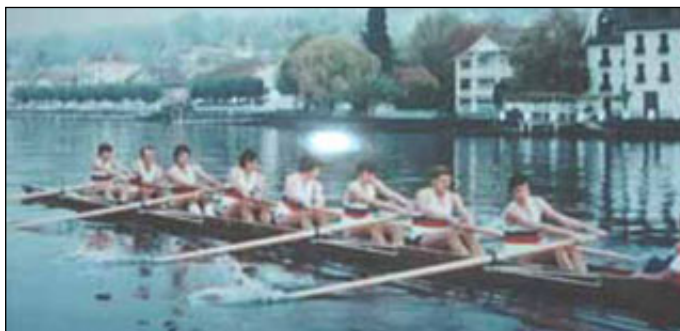
Le club à ce jour