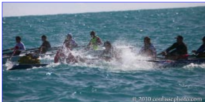
Equipes sur le parcours.

Sur un parcours de 7 km, un premier bord de vent « pour », après virage, deux portions de 500 m très chahutées par le ressac des falaises puis un retour de 3 km en vent « contre ». Le tout dans une mer bien formée et une vague méditerranéenne.