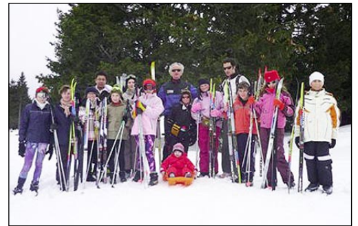
Le groupe et les accompagnants

Les 12 rameurs (ses) inscrits (es), étaient présents (es) pour perfectionner, ou découvrir le skating sur deux jours de stage dans le massif du Semnoz sur les hauteurs d'Annecy.