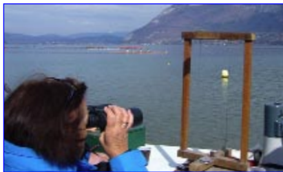
A l'arrivée, madame l'arbitre.