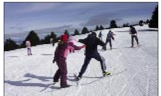
La petite épreuve...

Ces deux jours se sont bien passés, tout le monde a fait des progrès, beaucoup même pour certains ! exercices techniques, promenades, une petite épreuve pour terminer le stage.