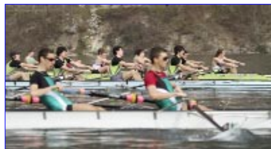
4- barreur garçons

Une nouvelle fois le Comité de Savoie, ses bénévoles et le corps arbitral, ont fait de cette journée une réussite qui sert l'intérêt de l'aviron.