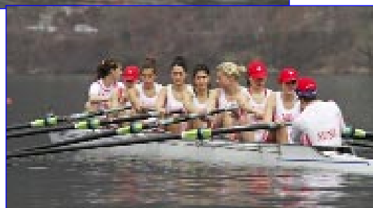
8+ filles de l'AUN Lyon