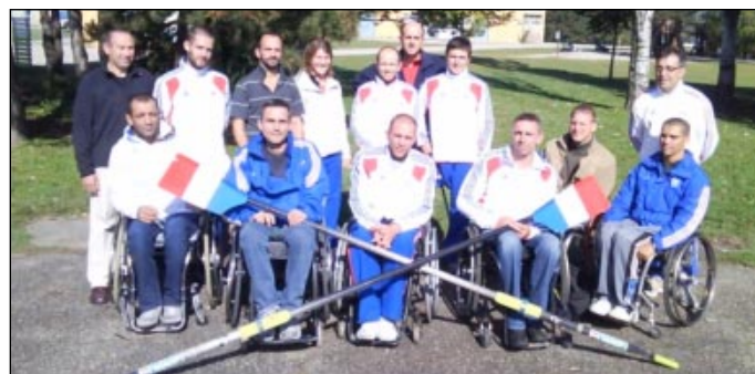
Texte/photo, N. Badez

Cette découverte aviron était programmée dans le cadre de leur plan d'entraînement de préparation au Mondial de Paris qui se déroulera au Grand Palais du 4 au 13 nov 2010.