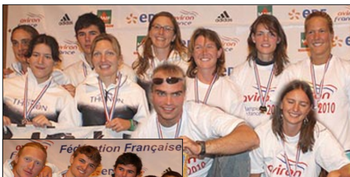
Photos des médaillés, haut gauche les 4+ filles du CA Thonon, à droite les 4+ filles de Av. Meyzieu - Photo bas, haut les 4+ garçons du CA Thonon, en bas les 2x filles de Av. Grenoble.