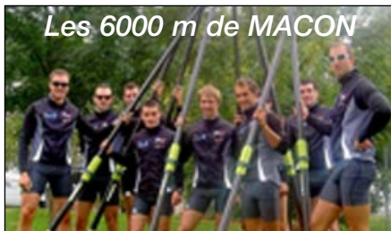
Les 6000 m de MACON

La première édition des 6000 de Mâcon s'est déroulée dans de bonnes conditions, sur un bassin plat et un ciel couvert, températures agréables, plus de 450 participants soit 79 équipages. C'est au superbe huit du pôle Aviron France de Nancy qu'est revenu la palme de l'épreuve, le bateau de l'équipe de France « seniors » a ainsi établi le record du bassin en 17'32".