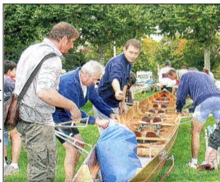
Le montage par l'équipe de Colmar

Les clubs les plus lointains venaient de Saint-Nazaire ou de Rouen, marquant ainsi l'importance nationale de ce grand rendez-vous de l'aviron de loisir. M.K.