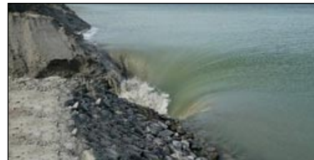
Les eaux ont envahi le Stade Nautique

Dès à présent le bassin olympique de 2,3 kms de long est totalement plein. Destiné à l'aviron, au canoë-kayak, au triathlon et à la nage en eau libre, il accueillera sa première compétition d'aviron le 27 mars 2011 avec l'organisation du championnat régional de bateaux courts.