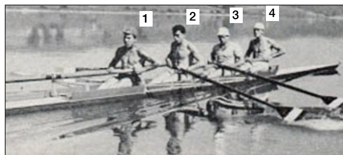
Vous possédez de vieilles photos d'aviron, vous désirez qu'elles soient publiées, expédiez les à : andre.74@tree.fr, d'avance la ligue vous remercie, elles vous seront rendues.