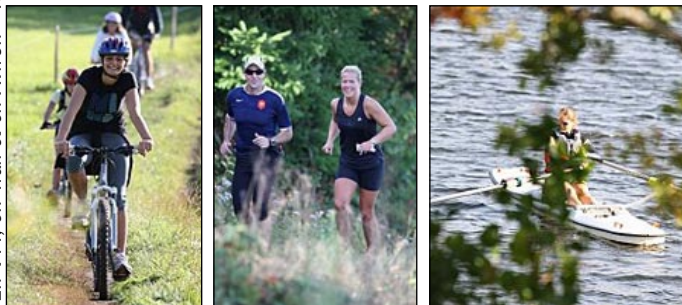
En VTT, en Trail et en Aviron - Texte : CD 69

Maintenant l'avenir est à envisager et nous semble promis à une forte audience, pour une épreuve "grand public".