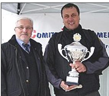
Le président du CDAR à gauche et le représentant de l'AUN Villefranche à droite