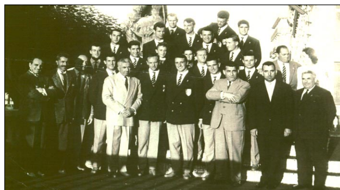
L'équipe de France de 1962