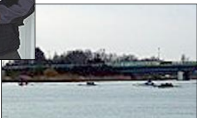
Le plan d'eau

L'AUN de Villefranche, l'emportait pour la seconde année consécutive, devant le CA Lyon, l'AUN Lyon, Aviron Meyzieu, Aviron Décines et l'AC Lyon Caluire.