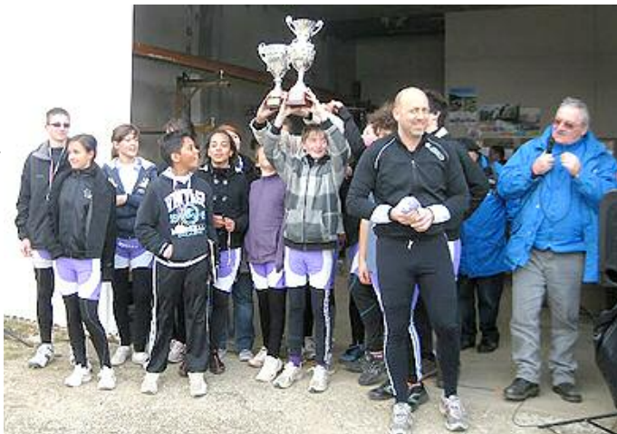
Photo du CDAA, remise des prix