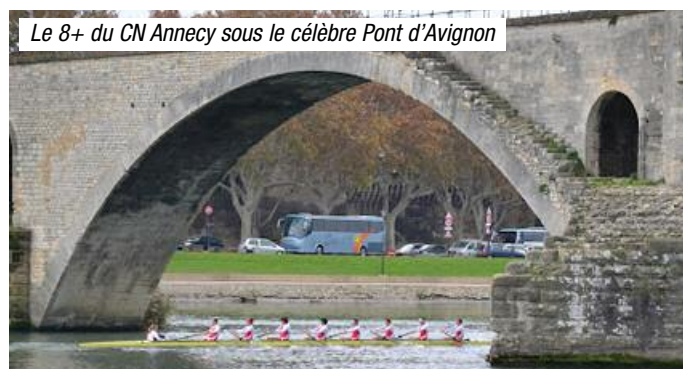
Le 8+ du CN Annecy sous le célèbre Pont d'Avignon