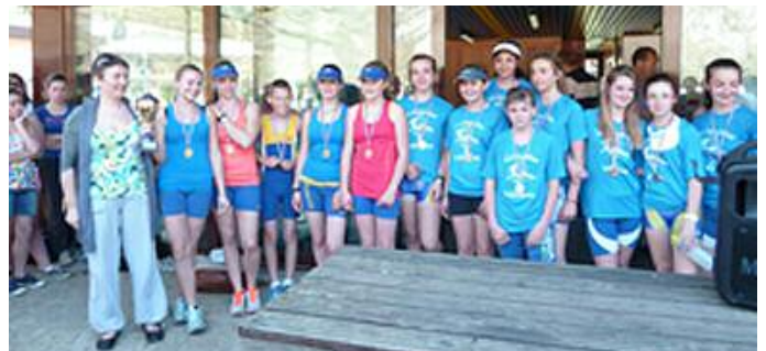
Les scolaires et universitaires