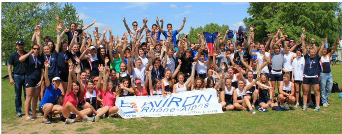
Le groupe des Rameurs / Rameuses Rhônalpins participants à la Coupe de France Maif