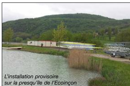
L'installation provisoire sur la presqu'île de l'Ecoinçon

Déménagement de l'ancien club de l'APP pour permettre aux entreprises de construire les bâtiments de la base du club de l'Aviron Bugey Haut-Rhône aux Ecassaz. Les travaux démarrent courant mai.