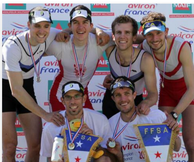
HSPL2- 2ème E JONVILLE (GRENOBLE AV) - A MOUTERDE (LYON AUN) 3ème C DURET (GRENOBLE AV) - T ONFROY (VERDUN CN) 1er G RAINEAU (NANTES CA) - F SOLFOROSI (LYON AUN)